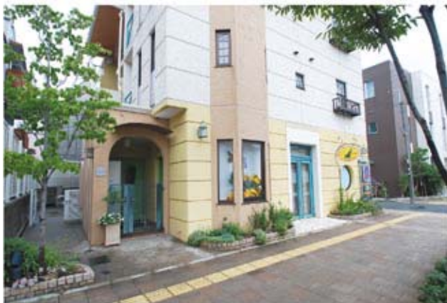
花壇が美しいこのマンションの1F奥に、私たちのデザインルームがあります。お気軽にお訪ねください。

復元したお庭を見てお客様は「そういえば、昔こんな庭だったわ。」とおっしゃられました。そして、コレクションされていた鉢植えのポタンを地植えにしてもっと楽しめるお庭にしたいとご希望されています。